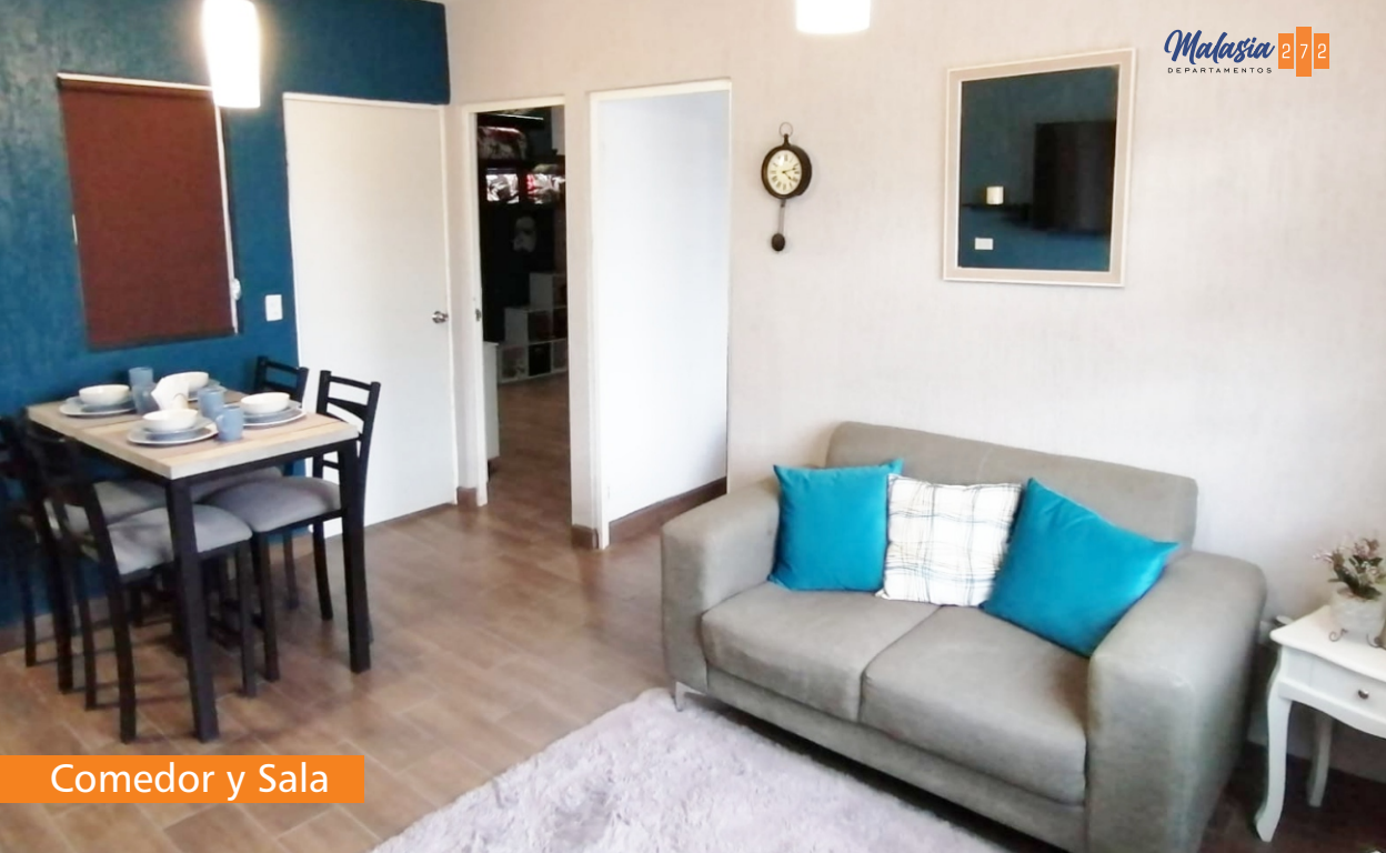
Comedor y Sala